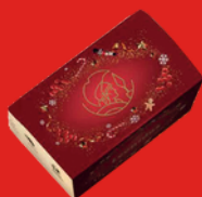
CHOCOLATS ASSORTIS 500 g