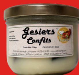
GÉSIRS DE CANARD CONFIT Bocal pour 4