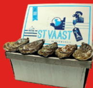
HUÎTRES N°2 La douzaine