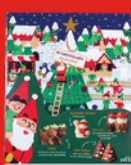
BOÎTE SUJETS NOËL 245 g 19 chocolats