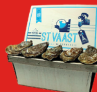
HUÎTRES N°4 La douzaine