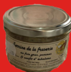
TERRINE AU FOIE GRAS POMMES & CONFIT D'ÉCHALOTTES 180 g