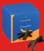
CUBE ORANGETTES 250 g