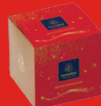
CUBE PÂTES DE FRUITS 250 g