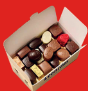
CHOCOLATS ASSORTIS 250 g

Leonidas The Preferred Belgian Chocolates