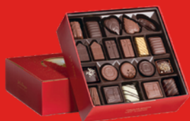
CHOCOLATS ASSORTIS 500 g 42 chocolats