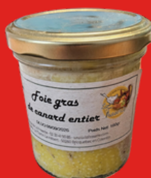
FOIE GRAS DE CANARD ENTIER 350 g