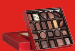
CHOCOLATS ASSORTIS 250 g 21 chocolats