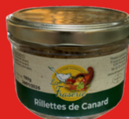
RILLETES DE CANARD AU FOIE GRAS 180 g