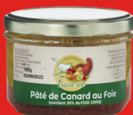
PÂTÉ DE CANARD AU FOIE GRAS 180 g