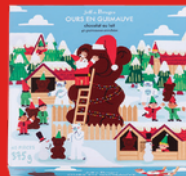
OURS GUIMAUVE CHOCOLAT AU LAIT 39 chocolats