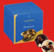
CUBE MENDIANTS 250 g