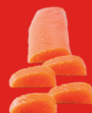
SAUMON FUMÉ ALGUES Cœur de filet 250 g