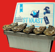
HUÎTRES N°3 La douzaine