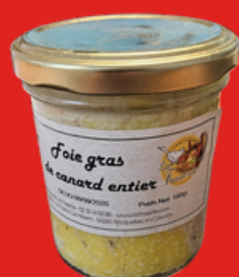
FOIE GRAS DE CANARD ENTIER 160 g